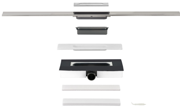
Abb.: Ablauf vorne/hinten

Flexibel anpassbares zweiteiliges Ablaufsystem für barrierefreie Duschplätze mit werkseitig angebrachtem selbstklebenden Abdichtungsflansch für die Verbundabdichtung BLANKE DISK