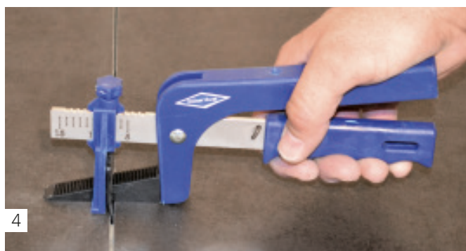
4 Keil einpressen, ausrichten der Fliesen