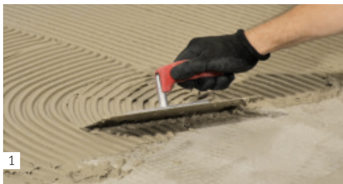
1 Auftragen des Fliesenklebers