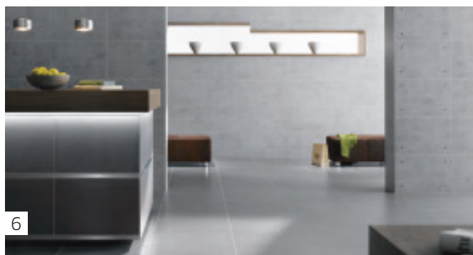
6 Ausfugen, fertig