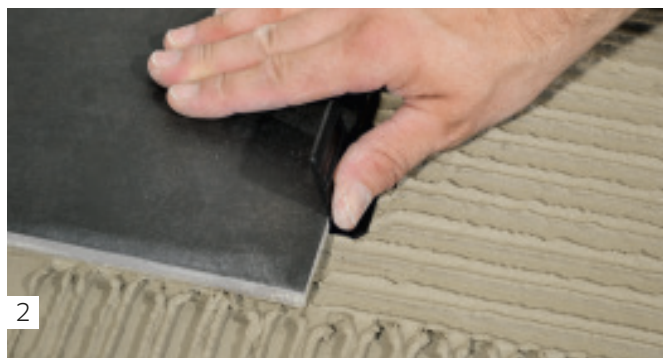
2 Einsetzen der Zugplatten