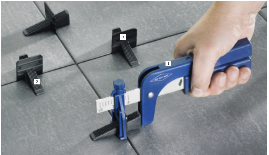
1 BLANKE LEVITO Zange 2 BLANKE LEVITO Keil 3 BLANKE LEVITO T-Zugplatte