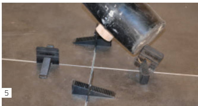
5 Nach Trocknung Zugplatten abtrennen