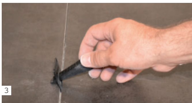
3 Einschieben der Spannkeile